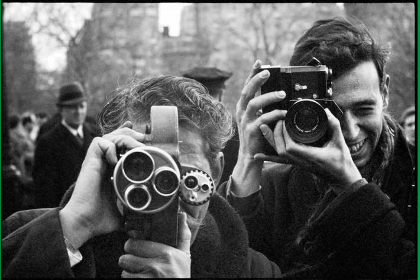
Paul McCartney. Photographes à Central Park. New York, février 1964