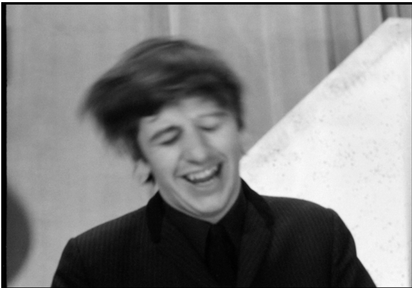
Paul McCartney. Ringo Starr. Londres, janvier 1964