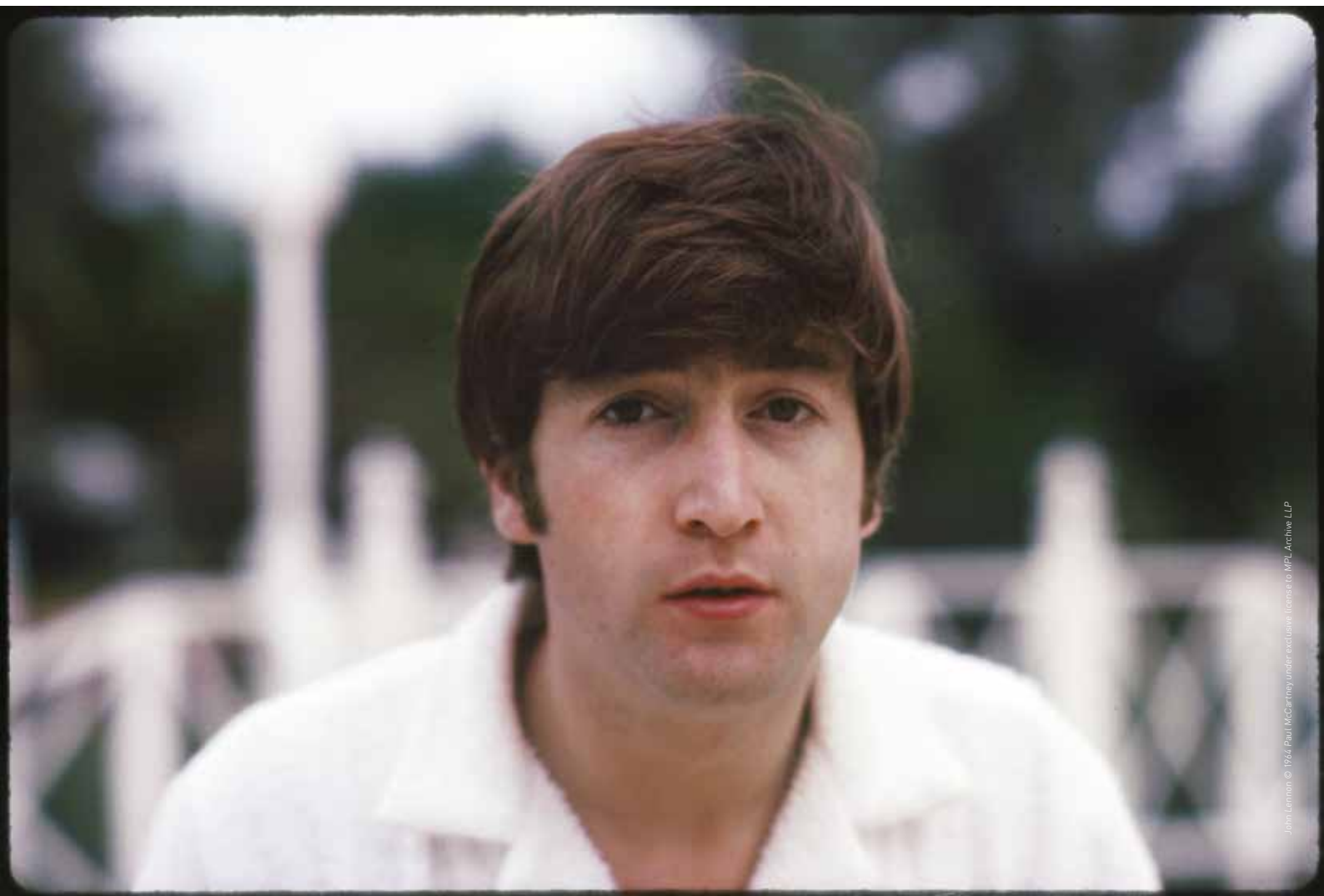
John Lennon