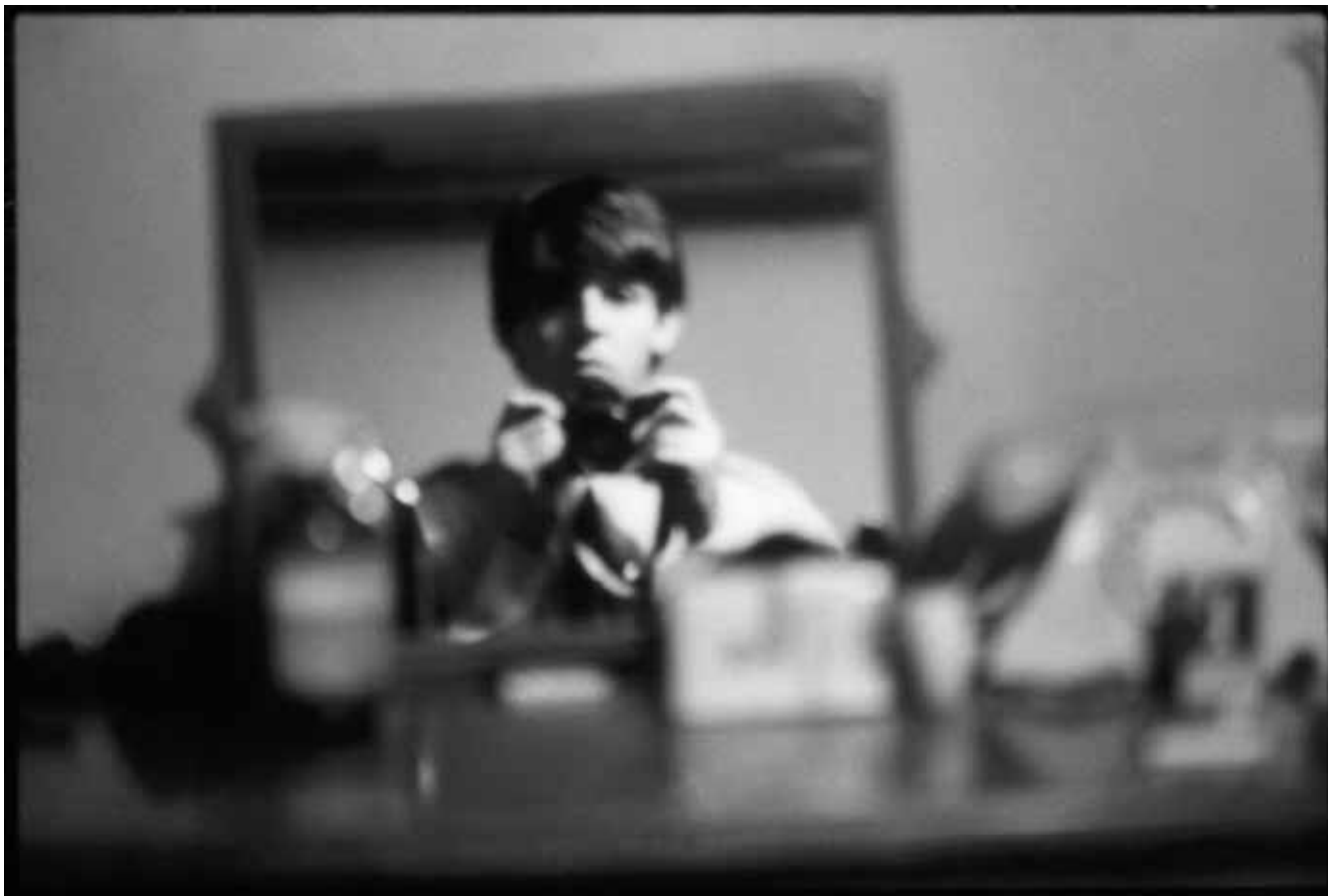
Paul McCartney. Autoportrait. Londres, 1963

L'exposition Paul McCartney, photographe 1963-64 présentée au musée Granet à l'été 2026 rassemble une collection de près de 250 photographies prises par le musicien britannique Paul McCartney, au moment-même où les Beatles, jusqu'alors sensation musicale britannique, accèdent au statut de superstars planétaires. Au travers de photographies en noir et blanc et en couleur, de clips vidéo et de documents d'archives, cette exposition offre un aperçu unique de ce phénomène culturel connu sous le nom de Beatlemania.