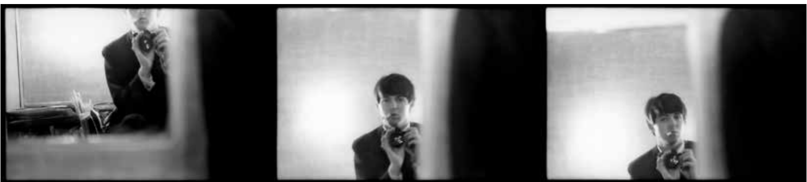
Paul McCartney. Autoportraits. Paris, Janvier 1964

Cet héritage photographique est encore renforcé lorsque Paul épouse la photographe professionnelle Linda Eastman en 1969. Cette histoire se perpétue aujourd'hui à travers le travail de leur fille, la photographe Mary McCartney.