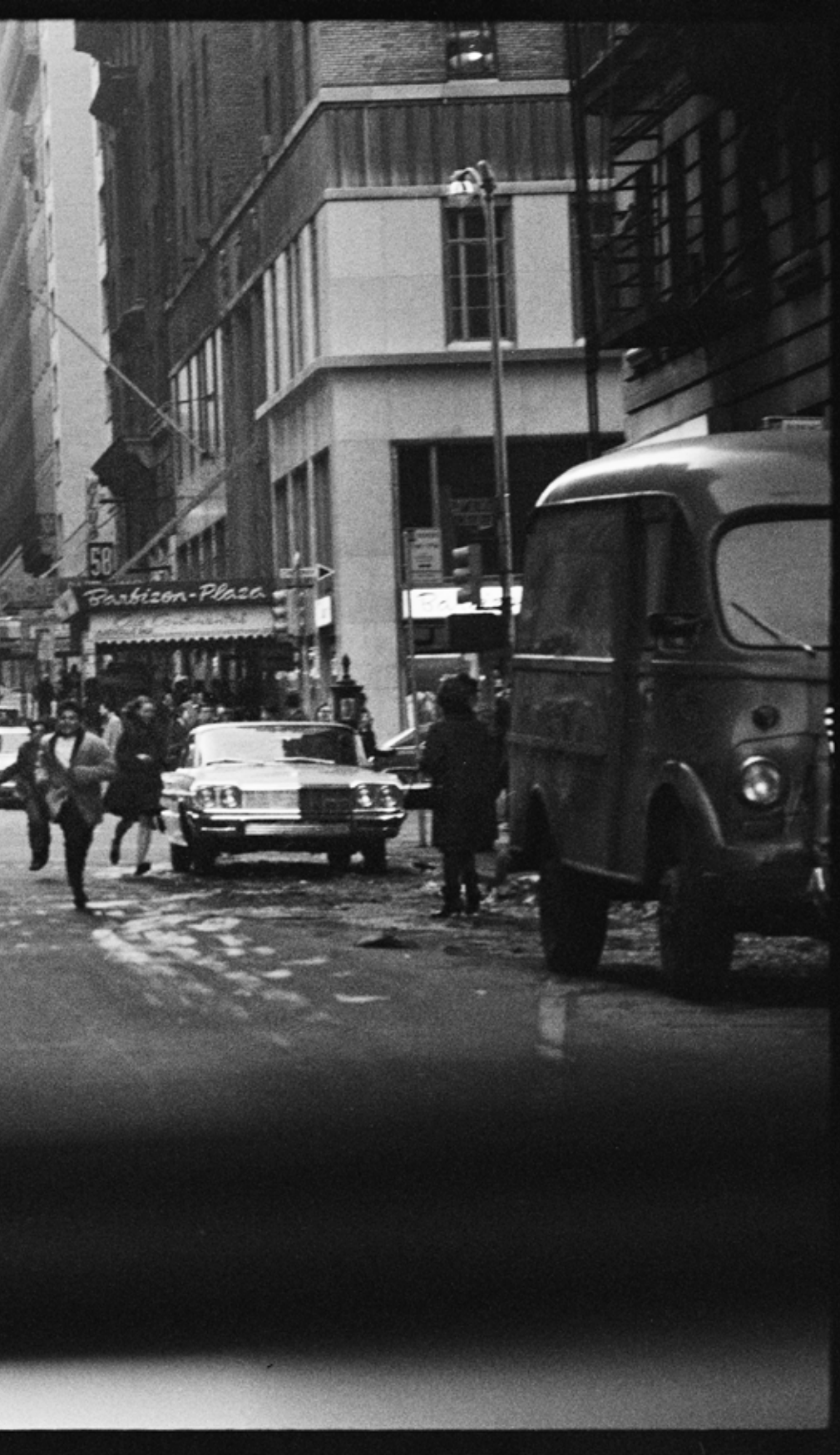
Paul McCartney. West 58th Street, à l'intersection de la Sixième Avenue. Février 1964