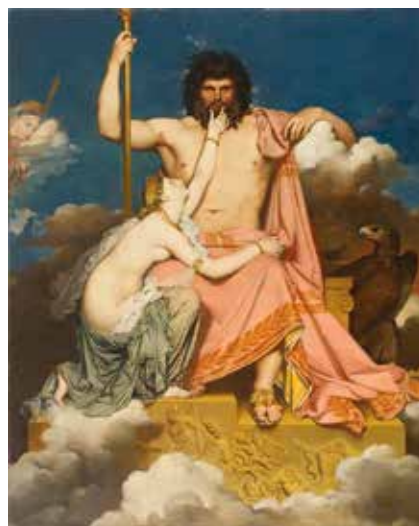
Jean Auguste Dominique Ingres, Jupiter et Thétis , 1811, huile sur toile, 324 x 260 cm,

Autour de ces collections exceptionnelles, le musée Granet développe une programmation dynamique d'expositions temporaires, de médiations, d'activités pédagogiques et culturelles. Il confirme ainsi sa politique d'ouverture à l'art moderne et contemporain, sans pour autant négliger l'art ancien, suivant en cela la leçon cézannienne entre tradition et modernité.