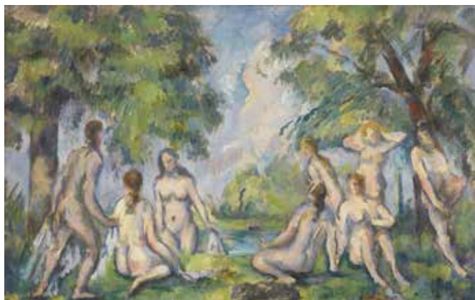
Paul Cézanne, Les Baigneuses , v. 1890 Huile sur toile, 29 x 45 cm, dépôt du musée d'Orsay au musée Granet, 1984 - Musée Granet, Aix-en-Provence

Le musée Granet présente près de 750 œuvres qui offrent un vaste panorama de la création artistique depuis les primitifs et la Renaissance, jusqu'aux chefs-d'œuvre de l'art moderne et contemporain.