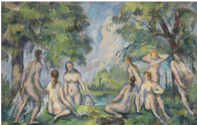
Paul Cezanne, Les Baigneuses , v. 1890 Huile sur toile, 29 x 45 cm, dépôt du musée d'Orsay au musée Granet, 1984 - Musée Granet, Aix-en-Provence

Le musée Granet présente près de 750 œuvres qui offrent un vaste panorama de la création artistique depuis les primitifs et la Renaissance, jusqu'aux chefs-d'œuvre de l'art moderne et contemporain.