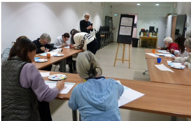
Atelier adapté pour adultes en situation de handicap.

Des visites guidées et des ateliers adaptés (peinture, dessin, sculpture, écriture) sont proposés régulièrement à de petits groupes en situation de handicap mental, cognitif ou psychique (6 à 10 personnes par groupe).