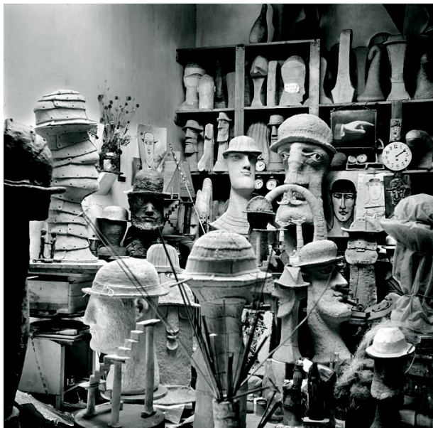
Kosta Alex ou l'Homme au chapeau, 1971

Du 11 avril au 30 août 2026 [dates à confirmer], le musée Granet propose une exposition temporaire consacrée au sculpteur gréco-américain Kosta Alex (1925-2005).