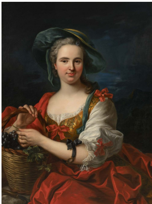
Jean-Baptiste Van Loo, Portrait de Mme Albert de Bormes en vendangeuse , XVIII e s, huile sur toile, 100 x 76 cm, legs marquise de Gueidan, 1880 © musée Granet, Ville d'Aix-en-Provence / Claude Almodovar.

Trois salles au niveau -1 sont consacrées aux collections du XIV e au XVIII e siècle.