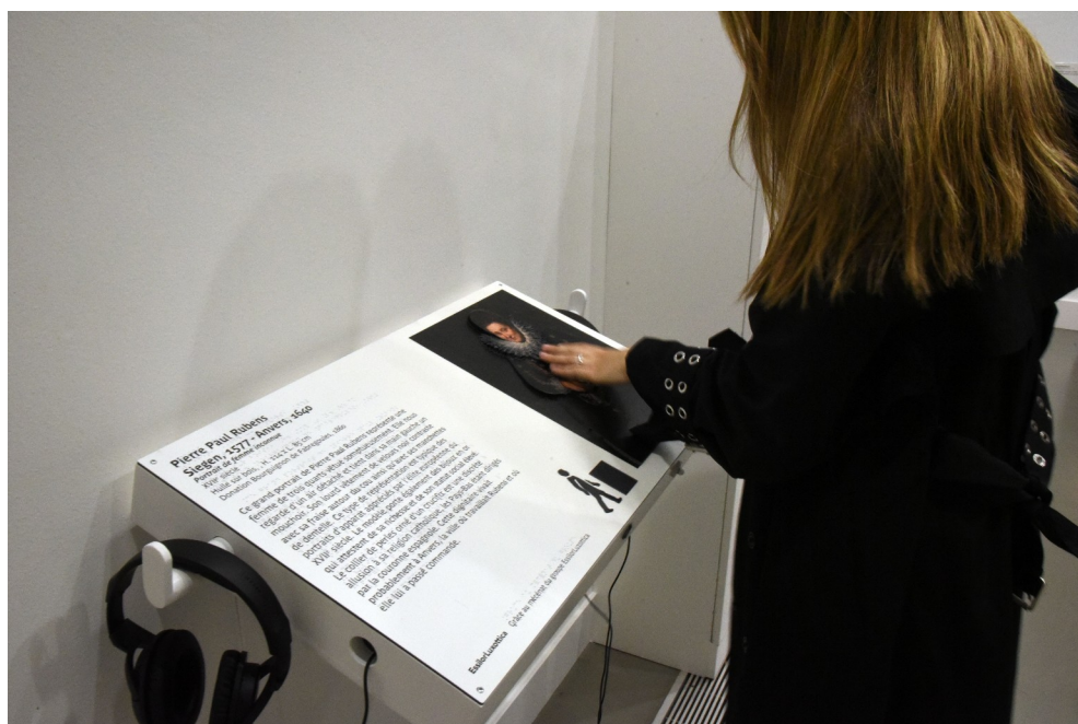
Dispositif tactile EssilorLuxottica.

L'ensemble est accessible au niveau -1 du musée dans un espace dédié au milieu des collections du XIV e au XVIII e siècle et au niveau +1 dans la donation Meyer.