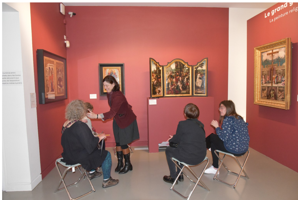
Visite adaptée pour la Journée du handicap, le 19 avril 2025 © musée Granet.

Des visites guidées en lecture labiale pour des groupes d'adultes mal ou non-entendants sont organisées sur demande dans les collections permanentes et les expositions temporaires du musée Granet.