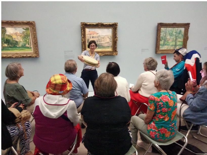
Visite adaptée sur pliants dans l'exposition « Cezanne au Jas de Bouffan » (28 juin-12 octobre 2025) © musée Granet.

A noter : des fauteuils roulants et des sièges pliants sont à disposition sur simple demande aux accueils du musée.