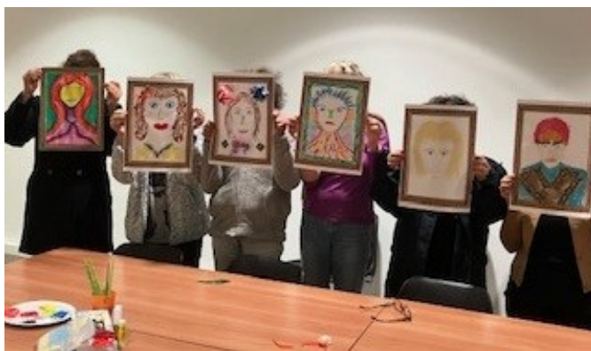
Restitution d'un atelier avec le CSAPA-Aix.

Ces propositions sont adaptées en fonction du handicap et des demandes des participants.