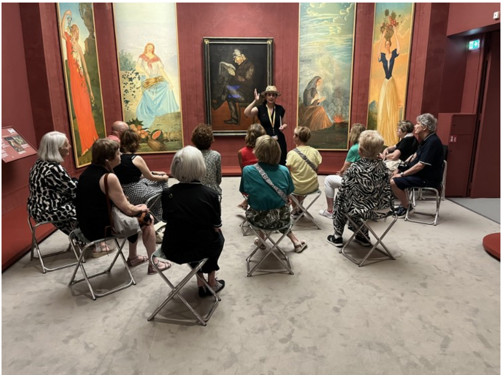
Visite adaptée au handicap visuel dans l'exposition « Cezanne au Jas de Bouffan » (28 juin-12 octobre 2025) © M. Castillon.

Ces visites spécifiques accompagnées par une médiatrice culturelle du musée, sont conçues et réalisées pour un public de déficients visuels.