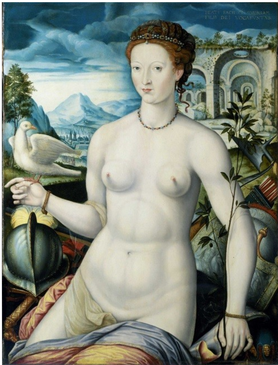
Anonyme, École de Fontainebleau, Diane de Poitiers en allégorie de la Paix , XVI e s, huile sur bois, 101 x 77 cm, donation Bourguignon de Fabregoules, 1860 © Claude Almodovar, musée Granet / Ville d'Aix-en-Provence.