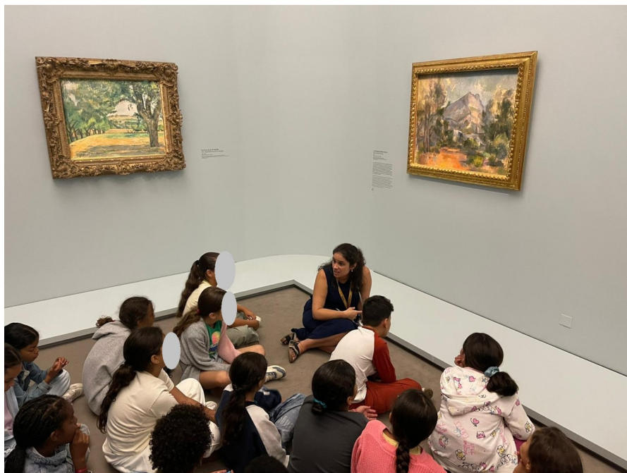
Médiation pour des scolaires dans l'exposition « Cézanne au Jas de Bouffan » (28 juin-12 octobre 2025) © musée Granet.

Attention : Certaines de nos œuvres peuvent être absentes des espaces d'exposition pour plusieurs raisons : prêts, restaurations, changements d'accrochage ou rotations des œuvres graphiques pour des raisons de conservation.