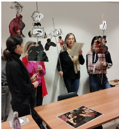
Formation autour des peintures anciennes pour les enseignants du 1 er degré © musée Granet.

Pour plus de renseignements sur les modalités et les thématiques, n'hésitez pas à vous rapprocher de Laure Polizzi , enseignante détachée au service éducatif du musée Granet : laure.cuneo@ac-aix-marseille.fr