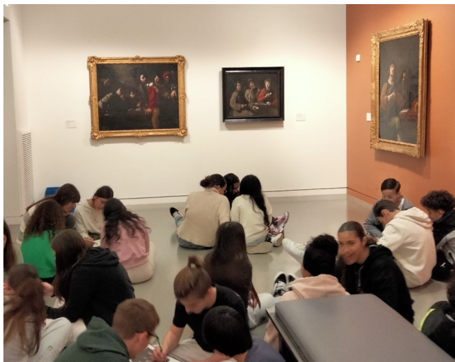
Atelier d'écriture face aux œuvres pour une classe de lycée © musée Granet.