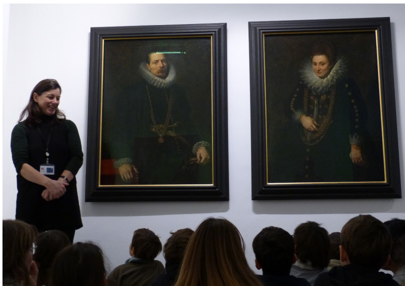
Médiation pour une classe d'élémentaires.

Lieu : Granet XX e , collection Jean Planque, extension du musée Granet.