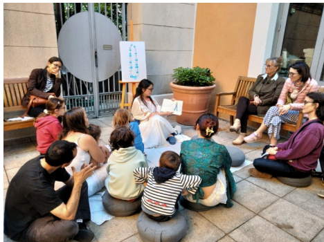
Fausse vente aux enchères et médiation contée.