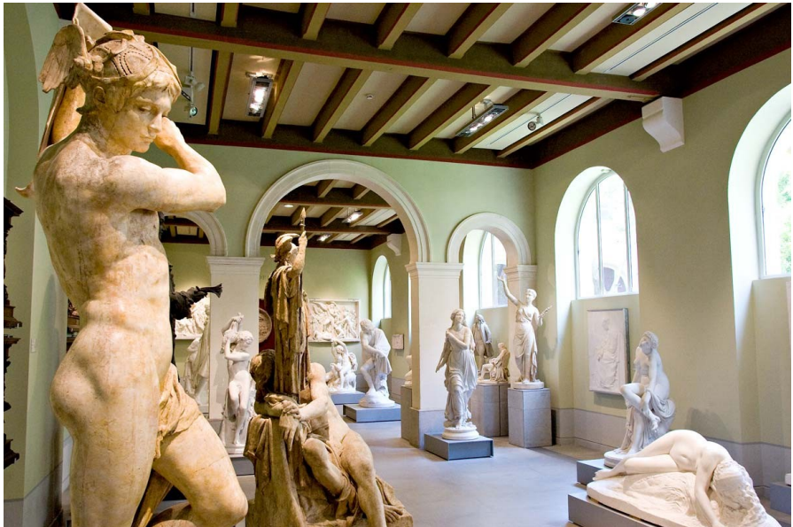
Galerie de sculpture.

Lieu : galerie de sculpture (rez-de-chaussée).