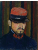
Charles Camoin Autoportrait en militaire