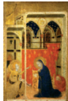
Maître de l'entourage de Simone Martini L'Annonciation

Le parcours débute par une salle consacrée au Moyen-Âge et à la Renaissance. Parmi les primitifs, on doit noter un diptyque représentant l'Annonciation et la Nativité de l'entourage du maître siennois, Simone Martini et une Vierge en gloire de Robert Campin dit le Maître de Flémalle. Les peintures flamandes et hollandaises et hollandaises sont ensuite représentées dans leur diversité : scènes de genre, paysages et portraits du XVII ÈME siècle composent une unité muséographique autour d'un autoportrait de Rembrandt , et de deux portraits peints par le jeune Rubens au retour d'un voyage en Italie. Viennent ensuite les collections d'œuvres italiennes essentiellement du Seicento avec les natures mortes romaines de Spadino ou Campidoglio. L'expression religieuse de la Contre-réforme s'impose avec majesté grâce à des œuvres signées Le Guerchin, Preti, Cerrini.