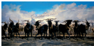
Emile Loubon Les menons en tête d'un troupeau en Camazque