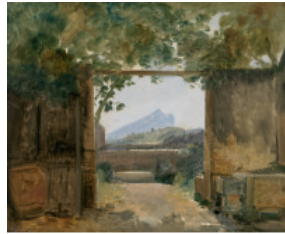
François Marius Granet La Montagne Sainte-Victoire vue d'une cour de ferme