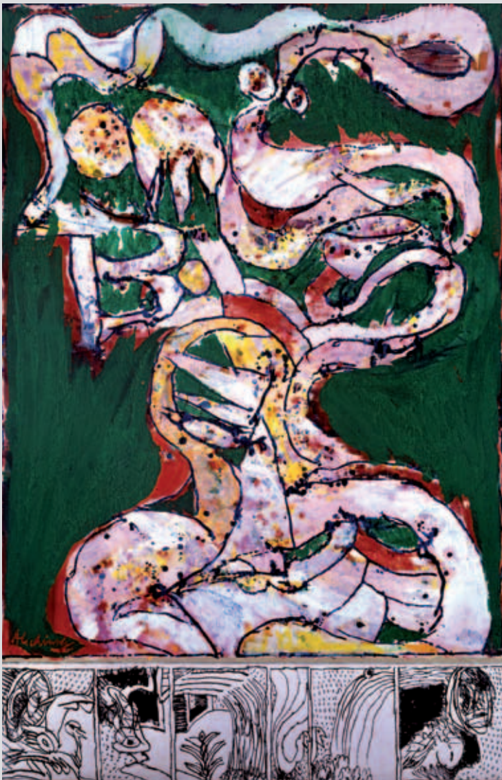
Pierre Alechinsky Le Sentiment du déjà vu, 1967-1976 acrylique avec une prédelle à l'encre de Chine, vélin marouflé sur toile et panneau, 236 x 154 cm.

LES ATELIERS DU MIDI 5 juin - 3 octobre 2010