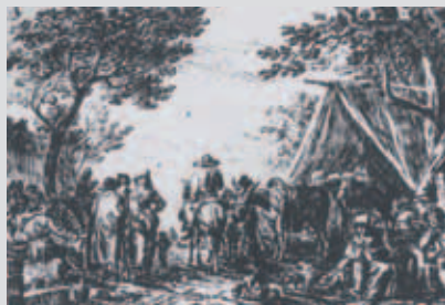
Jean-Antoine Constantin (1756-1844), Halte de villageois dans la campagne (Plume et encre de chine, 27x40cm)