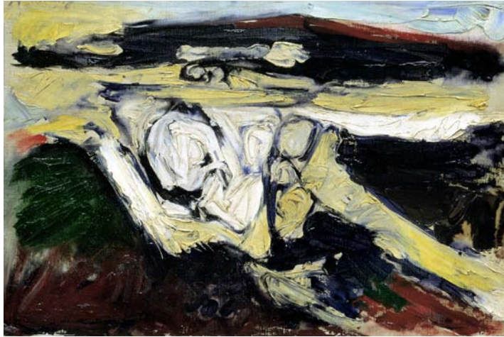
Paysage regardant , 1955, huile, 38 x 50 cm © ADAGP