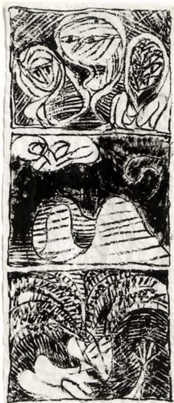
Le Pinceau voyageur , porcelaine © ADAGP

Chaque artiste, où qu'il aille, emporte avec lui un petit univers portatif qui est son monde propre. Van Gogh, arrivé en Provence, croyait y voir l'écho du Japon dont il avait rêvé. Devant le même paysage de la Crau, Alechinsky en train d'illustrer Le Volturno découvrait dans les rythmes des blés en herbe ondulant sous le vent une autre manière de peindre la mer déchaînée du texte de Cendrars. De même, si la Suite des Bouches-du-Rhône est indissociable de l'image des contreforts des Alpilles que le peintre voyait, en travaillant, par la fenêtre de son hôtel, le film d'images qu'elle déroule trouve sa logique et sa forme dans le plateau de la petite table sur laquelle il travaillait. Sans rien oublier de ses racines, de l'apprentissage que fut pour lui Cobra, des images récurrentes qui marquent son travail (volcans, coiffes des Gilles de Binche, volutes d'écorces d'orange, escaliers, labyrinthes...), Alechinsky a trouvé, en rencontrant le Sud, les multiples claviers où improviser, comme avec les différentes voix d'un orgue, sur une partition sue par cœur, d'imprévisibles et somptueuses variations.