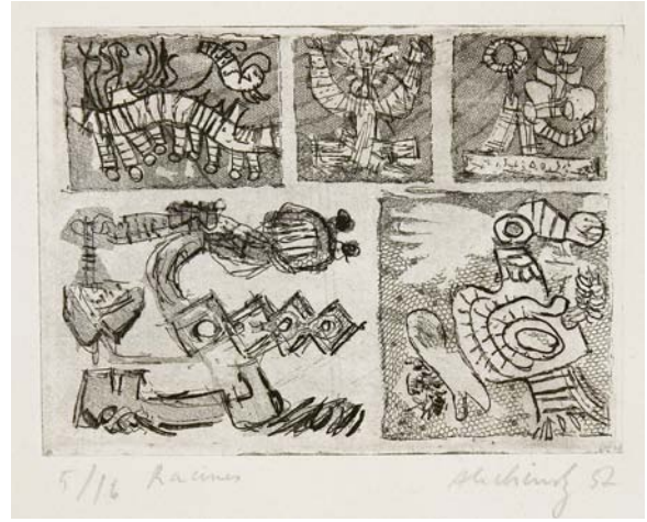
Racine , 1952, eau-forte, 25x32 cm © ADAGP